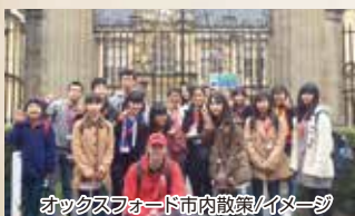
オックスフォード市内散策/イメージ

スポーツ・アートクラフト・ダンス・ゲーム大会といったアクティビティを体験。夕食後はカラオケやディスコといった時間が毎日設けられており、教室での座学だけでなく、様々な活動を通して生きた英語を身につけます。