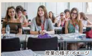
授業の様子/イメージ