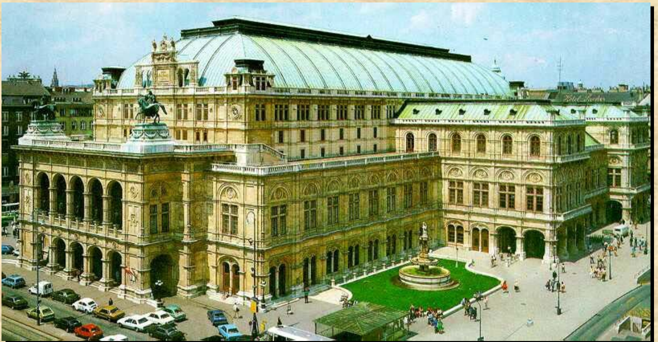
オペラ座（イメージ）