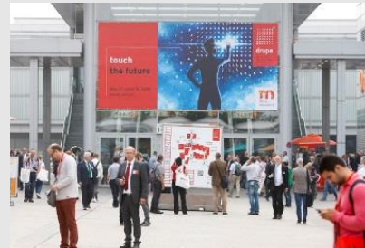
過去のdrupaの様子

ジュネーブ:クラウン プラザ ジュネーブ ★★★★★ ベンスベルグ(ケルン郊外):グランドホテル ショロス ベンスベルグ★★★★★ ★...「世界ホテル案内」基準による)