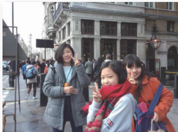
▲ロンドン観光/イメージ