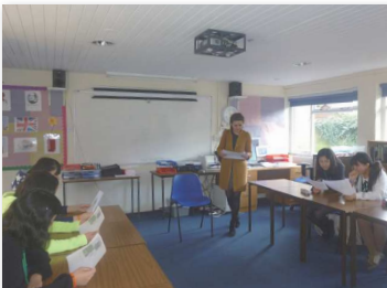
▲英語レッスン/イメージ

パブリックスクールとは、寮制の名門私立学校です。私立学校の中でも格位が高く、各界に多くの著名人を輩出してきた長い歴史と伝統を持つ学校で、教師や教育内容、学校の設備などの水準が一流とみなされている学校です。高い学力を身につけるだけでなく、社会性や強い精神を育むことができます。