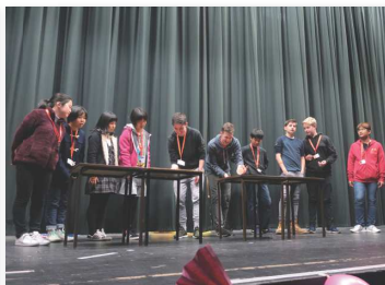
▲アクティビティ(ゲーム大会)/イメージ