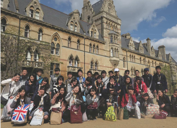
▲オックスフォード市内にて/イメージ

参加対象(現学年)：中学1年生～17歳 期間：2019年3月29日(金)～4月6日(土)9日間