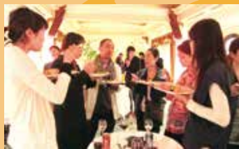
懇親会の様子(イメージ)